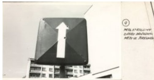
9 MIEJSCOWOŚĆ ZARÓDZAJĄCY MIEJSCOWOŚĆ