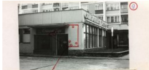
9 Duktaria "Ptyd" przy ul. Klasznej 1 w 5 wykropnotownym blakim po poriskach