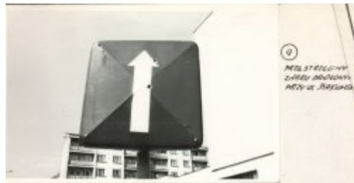
8 MIEJSCOWOŚĆ ZARÓDZAJĄCY MIEJSCOWOŚĆ