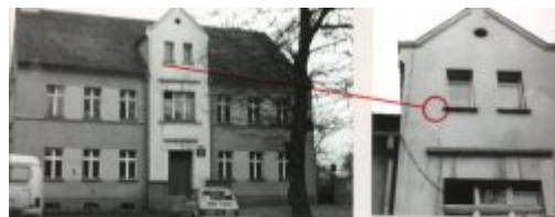
• BUDYNEK MEDYKALNY POD W. PRAKTYCZNYM ZB. Z PRACOWNIĄ NA WYM. II PIĘTRZE