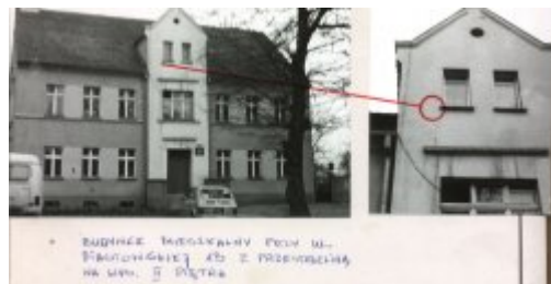
• BUDYNEK MEDYKALNY POD W. PRAWOŚCIĄ 15 I PRZEMYSŁOWA NA WYM. II PĘTAKA